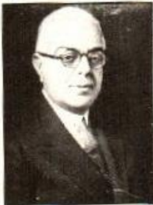
سر آغا خان

اپنے حقوق سے بدستور محروم رہتے۔ چنانچہ سر آغا خان، مسلمان رہنماؤں کا وفد لے کر یکم اکتوبر 1906ء کو وائسرائے لارڈ مینٹو سے شملہ میں ملے۔ تاریخ میں اس کو شملہ وفد کا نام دیا جاتا ہے۔ وفد کے اہم مطالبات کا خلاصہ درج ذیل ہے۔