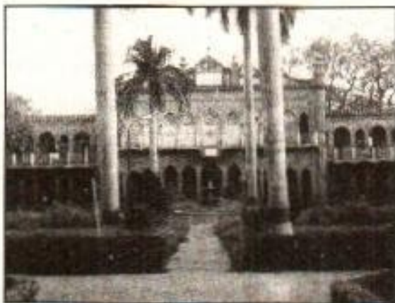
علی گڑھ مسلم یونیورسٹی کا ایک منظر

”سائنٹیفک سوسائٹی“ کے تحت آپ نے انگریزی زبان میں لکھی گئی بعض کتابوں کا اردو ترجمہ بھی چھپوایا۔ آپ کی کوششوں سے 1866ء میں ایک ہفتہ وار علمی اخبار ”علی گڑھ انسٹی ٹیوٹ گزٹ“ شائع کرنے کا اہتمام کیا گیا۔ اس کے ایک کالم میں مضمون کی انگریزی عبارت اور دوسرے میں اس کا اردو ترجمہ ہوتا تھا۔ اس سے سر سید احمد خاں کی خواہش تھی کہ جو مسلمان انگریزی نہیں جانتے وہ بھی اردو عبارت پڑھ کر جدید علوم و فنون سے واقف ہو جائیں۔