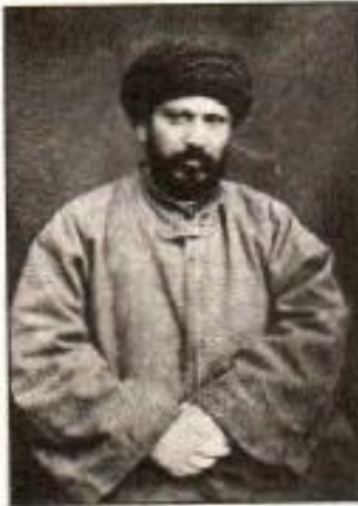
جمال الدین افغانی

کو مسلمانوں کی نمائندہ جماعت تسلیم کر لیا تھا۔ ہندوؤں نے مسلمانوں کے تمام مطالبات تسلیم کر لیے۔ ہندوؤں اور مسلمانوں کے مابین اتحاد کی فضاء قائم ہو گئی اور دونوں نے مل کر مشترکہ مفادات کے لیے جدوجہد کا آغاز کر دیا۔ ہندوؤں اور مسلمانوں کے مابین یہ پہلا اور آخری سیاسی مجھوت تھا۔ اس کے بعد وہ پھر کسی بات پر اتفاق نہ کر سکے۔ اسی معاہدے کی بدولت قائد اعظم ہندو مسلم اتحاد کے سفیر کہلائے۔