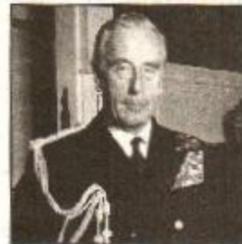
لارڈ مائٹن سٹین

برطانوی وزیر اعظم اٹلی (Atlee) نے برصغیر کو آزاد کر دینے کا وعدہ کر رکھا تھا چنانچہ 20 فروری 1947ء کو اپنا وعدہ پورا کرنے کے لیے اس نے اعلان کیا کہ جون 1948ء تک حکومت برطانیہ ہندوستان کو آزاد کر دے گی۔ اس دن سے اختیارات ذمہ دار لوگوں کو سونپ دیے جائیں گے۔ یہ اختیارات مرکزی حکومت یا بعض علاقوں میں موجود صوبائی حکومتوں کے سپرد کر دیے جائیں گے یا اس کے لیے کوئی اور موزوں طریقہ استعمال کیا جائے گا جو اہل ملک کے بہترین مفاد میں ہو۔ اس موقع پر یہ بھی اعلان کیا گیا کہ مارچ 1947ء میں لارڈ ویل کی جگہ لارڈ مائٹن سٹین وائسرائے کے عہدے کا چارج سنبھالیں گے۔