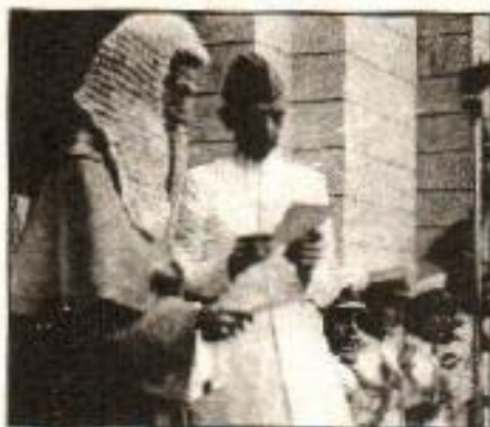
قائد اعظم پاکستان کے پہلے گورنر جنرل کا حلف اٹھاتے ہوئے

18 جولائی 1947ء کو برطانوی پارلیمنٹ نے قانون آزادی ہند 1947ء منظور کیا۔ اس کی رو سے برصغیر میں دو آزاد خود مختار مملکتیں وجود میں آئیں۔