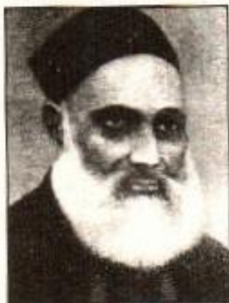
نواب وقار الملک

مسلمان رہنماؤں کا ایک نمائندہ اجتماع اکتوبر 1901ء میں لکھنؤ میں ہوا۔ جس میں ملے پایا کہ مسلمانوں کے سیاسی اور معاشرتی حقوق کی حفاظت کے لیے ایک تنظیم قائم کی جائے۔ چنانچہ ایک کمیٹی بنائی گئی جس کے ذمے یہ کام لگایا گیا کہ وہ کسی مناسب وقت پر تمام صوبوں کے مسلمان نمائندوں کا اجلاس بلائے کا اہتمام کرے۔ اس وقت تو نمائندہ اجلاس کا اہتمام نہ ہو سکا لیکن شملہ وفد کی کامیابی نے مسلمانوں کو اپنی علیحدہ جماعت کی تشکیل کی طرف متوجہ کیا۔ جو قومی سطح پر مسلمانوں کے مفادات کا تحفظ کر سکے۔