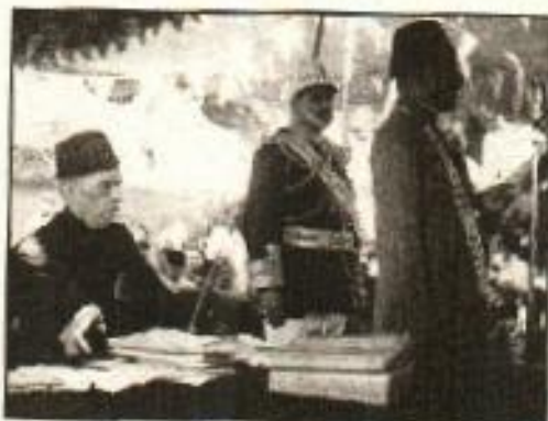
قائد اعظم اجلاس کی صدارت کرتے ہوئے

آزاد اور خود مختار قوم کی حیثیت سے اپنا تشخص قائم رکھ سکیں۔ قائد اعظم نے کہا کہ اگر برطانوی حکومت برصغیر کے لوگوں کے لیے واقعی امن اور خوشی چاہتے ہیں تو اس کے لیے ایک ہی راستہ ہے کہ وہ برصغیر کو دو خود مختار اور آزاد ریاستوں میں تقسیم کر دے۔ انھوں نے واضح کیا کہ مسلمان کوئی ایسا دستور قبول نہیں کریں گے جس سے ہندو اکثریت کی حکومت قائم ہو جائے۔ قائد اعظم کی تقریر کی روشنی میں ایک قرارداد مرتب کی گئی جسے 23 مارچ 1940ء کے اجلاس میں شیر بنگال فضل الحق