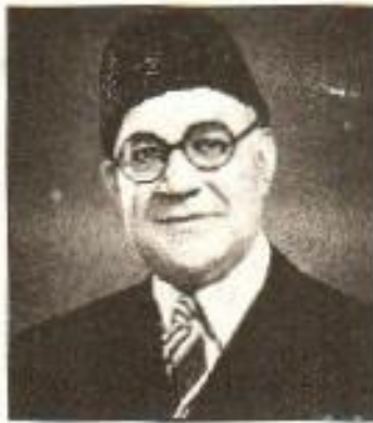
لیاقت علی خاں

لیاقت علی خاں کے سپرد خزانہ کا ٹکڑہ ہوا۔ ہندوؤں نے یہ ٹکڑہ مسلم لیگ کو صرف اس لیے دیا تھا کہ وہ اس کو چھانڈ سکے گی اور ناکام ہو جائے گی، مگر لیاقت علی خاں کامیاب وزیر خزانہ ثابت ہوئے۔ انھوں نے سالانہ بجٹ اس طرح تیار کیا کہ اس سے غریبوں کو فائدہ ہوا۔ ہندو سرمایہ دار گھائے میں رہے۔ بڑے بڑے ہندو ساہوکار کانگریس کو پیسے دیتے تھے، اب وہ کانگریس کے خلاف سراپا احتجاج بن گئے۔ اس پر ہندوؤں نے بجٹ کی مخالفت شروع کر دی جس سے حالات خراب ہونے کا خطرہ پیدا ہو گیا۔