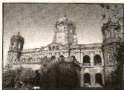
جنرل پوسٹ آفس، لاہور

انگریز دور میں ڈاک کے محکمے کو جدید طرز پر بنایا گیا کیونکہ انگریزوں کو اپنے احکامات برصغیر کے دور دراز کے علاقوں تک پہنچانے کے لیے اس محکمے کی بہت ضرورت تھی۔ نئے ڈاک خانے بنائے گئے اور وہاں تربیت یافتہ عملہ تعینات کیا گیا۔ 1887ء