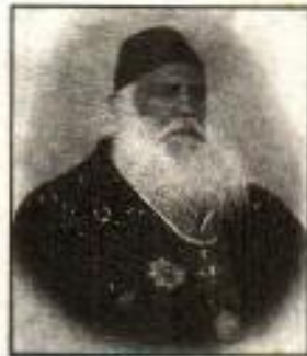
سر سید احمد خاں

سر سید احمد خاں 17 اکتوبر 1817ء کو دہلی میں پیدا ہوئے۔ سر سید احمد خاں چاہتے