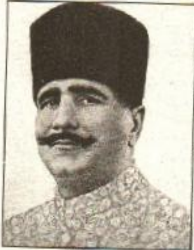
علامہ محمد اقبال

دسمبر 1930ء میں برصغیر کے کئی رہنما جب لندن میں گول میز کانفرنس میں مصروف تھے اور مستقبل کے انتظامات پر غور کر رہے تھے تو مسلم لیگ کا سالانہ اجلاس الہ آباد میں بلایا گیا۔ اس اجلاس کی صدارت علامہ محمد اقبالؒ نے کی۔ ان کا صدارتی خطبہ برصغیر کی سیاسی تاریخ میں بڑی اہمیت کا حامل ہے۔ اپنے خطبے میں علامہ اقبالؒ نے دو قومی نظریے پر روشنی ڈالی اور دلائل سے ثابت کیا کہ برصغیر دو قوموں کا وطن ہے اور مسلمان اس ملک میں ایک الگ اور مکمل قوم ہیں۔ اسلام ایک مکمل نظام حیات ہے جس میں سیاسی، معاشی اور ثقافتی مسائل کے بارے میں مکمل رہنمائی موجود ہے نیز مسلمان کسی حالت میں بھی اپنے مذہب سے دستبردار نہیں ہو سکتے۔ اگر ہندو