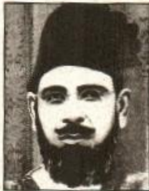
مولانا محمد علی جوہر

اس صورت حال سے برصغیر کے مسلمان تڑپ اٹھے۔ انھوں نے ترکوں کی حمایت میں تحریک چلائی جو تاریخ میں تحریک خلافت کے نام سے یاد کی جاتی ہے۔ مجلس خلافت کا قیام ستمبر 1919ء کو ٹول میں لایا گیا۔ اس کا مقصد یہ تھا کہ ترکی کی علاقائی سالمیت و خلافت برقرار رہے اور مقامات مقدسہ اس کے پاس رہیں۔ جب ہندوؤں نے دیکھا کہ مسلمان ایک عظیم اور پر جوش