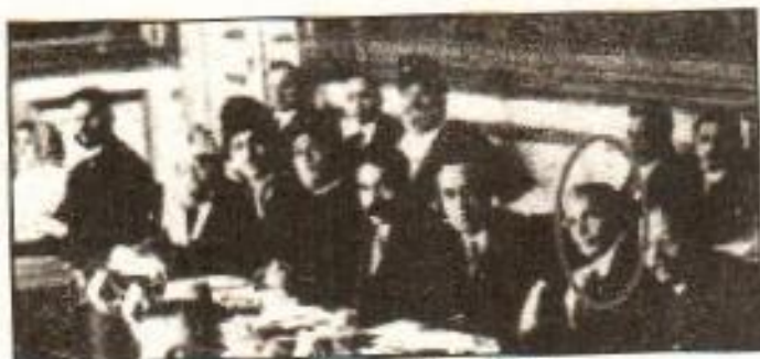
پہلی گول میز کانفرنس میں قائد اعظم نمایاں ہیں

برطانوی حکومت نے 11 نومبر 1930ء کو لندن میں گول میز کانفرنس منعقد کرنے کا اعلان کیا۔ کانگریس نے اس کانفرنس میں شرکت نہ کرنے کا فیصلہ کیا۔ مسلمانوں کی طرف سے اخبار نمائندوں نے، جن میں قائد اعظم، سر آغا خاں، مولانا محمد علی جوہر، سر محمد شفیع اور مولوی فضل الحق بھی شامل تھے،