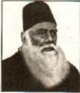
سر سید احمد خاں

مسلمانوں کو زوال کی حالت میں دیکھ کر سر سید احمد خاں کو بہت دکھ ہوا۔ چنانچہ آپ نے مسلمانوں کو وہی مقام واپس دلانے کے لیے کوششیں شروع کر دیں جو انگریز رائج سے پہلے ان کو حاصل تھا۔ آپ نے ایک رسالہ ”اسباب بغاوت ہند“ لکھا، جس میں بغاوت ہند کے اسباب بیان کرتے ہوئے آپ نے اس بات پر زور دیا کہ برصغیر کے لوگوں کی انگریزوں کے خلاف بغاوت کی سب سے بڑی وجہ یہ تھی کہ برصغیر کے لوگوں کی حکومت میں شمولیت نہ تھی اور ملک میں رائج ہونے والے قوانین عوام کے مزاج کے خلاف تھے۔ قانون ساز کونسل کے انگریز ممبران کو یہاں کے لوگوں کے مسائل اور روایات کا علم نہ تھا۔