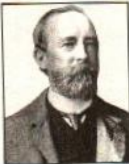
اے۔ او۔ ہیوم

مسٹر اے۔ او۔ ہیوم (A.O. Hume) انڈین سول سروس کے ایک اعلیٰ عہدیدار رہ چکے تھے۔ ابھی اے۔ او۔ ہیوم سرکاری ملازم تھا کہ اس کو 1879ء میں یہ خیال آیا کہ برصغیر کی سیاسی بے چینی، عوام کی اقتصادی مشکلات اور بڑھتی ہوئی سازشیں کہیں 1857ء کی جنگ آزادی کی صورت اختیار نہ کریں۔ مسٹر ہیوم نے سوچا کہ ملک میں کسی ایسے ادارے کی ضرورت ہے، جس کے ذریعے عوام اپنے خیالات کا اظہار کر سکیں۔ اس سلسلے میں اس نے 1885ء میں انڈین نیشنل کانگریس