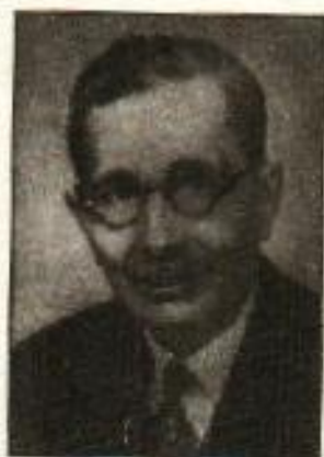
چوہدری خلیق الزماں

ان دنوں صوبہ یو پی کے مسلم لیگی صدر چوہدری خلیق الزماں تھے۔ انتخابات میں یو پی صوبے سے 27 مسلم نشستوں پر مسلم لیگی امیدوار کامیاب ہوئے تھے۔ چوہدری خلیق الزماں نے کانگریس رہنماؤں سے مذاکرات کیے اور کہا کہ وزارت میں مسلم لیگی نمائندے بھی لیے جائیں۔ یو پی کے کانگریس صدر نے مسلم لیگ کو وزارت میں شامل کرنے کے لیے کچھ ناقابل قبول شرائط رکھیں، جن کو مسلم لیگ نے ماننے سے انکار کر دیا۔ یہ اصل میں مسلم لیگ کے وجود کو ختم کرنے کا ایک منصوبہ تھا جسے مسلم رہنماؤں نے رد کر دیا۔